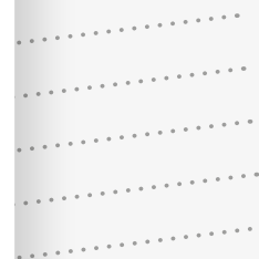
Renato Guttuso, La spiaggia , 1955-1956,